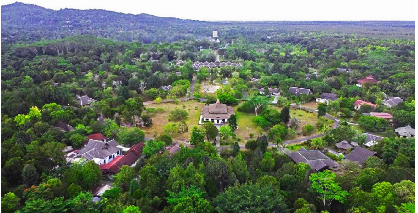
KOMPLEKS SUBUD RUNGAN SARI

Pada awal tahun 2000-an, pembangunan tahap pertama dari kompleks komunitas yang dikenal sebagai Rungan Sari (yang bermakna intisari dari Sungai Rungan) telah selesai dan menjadi tempat tinggal bagi komunitas multikultural dari Indonesia dan belahan dunia lainnya. Pada saat yang sama, sebuah hall latihan dibangun di pusat kota Palangka Raya. Area perumahan Rungan Sari terdiri dari sekitar 40 rumah. Ada juga berbagai proyek dan enterprise yang dijalankan oleh anggota berupa resort, sekolah, akademi sepak bola, eco-village, aula komunitas/pelatihan, dan fasilitas pertemuan dan olahraga - semuanya dikelilingi oleh hutan dan satwa liar.