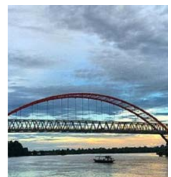
PALANGKA RAYA, IBU KOTA KALIMANTAN TENGAH