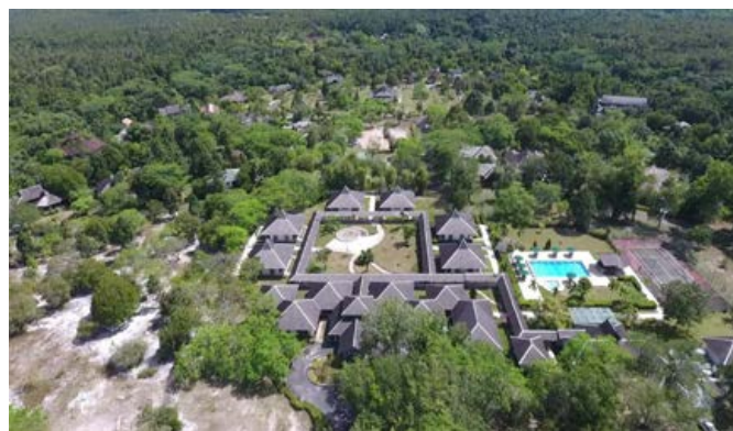
RUNGAN SARI RESORT

Di Rungan Sari terdapat sebuah pusat pertemuan dan resort, dua aula latihan dan sejumlah perusahaan dan proyek yang terus memberikan pengaruh pada daerah setempat. Rungan Sari dan sekitarnya merupakan rumah bagi lebih dari 150 warga Subud dan kelompok Subud yang cukup besar.