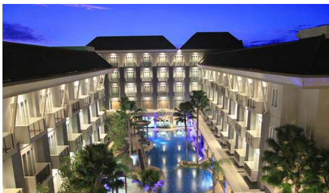
PEMANDANGAN KOLAM RENANG SWISS-BELHOTEL

Swiss-Belhotel Danum, sebuah cabang dari jaringan internasional Swiss-Belhotel, adalah hotel bintang 4 yang terletak hanya 25 menit dari bandara dan 35 menit dari Rungan Sari. Dengan atmosfer resor yang terbuka, santai, dan tenang, hotel ini telah dipilih sebagai salah satu lokasi untuk Kongres Dunia, terutama untuk lima hari pertama dan dua hari terakhir dari program tersebut. Dengan total 150 kamar untuk akomodasi, serta ruang pertemuan yang lengkap dan ballroom yang besar, Swiss-Belhotel Danum menjamin kenyamanan dan kemudahan peserta kongres untuk berbagai kegiatan dan pertemuan.