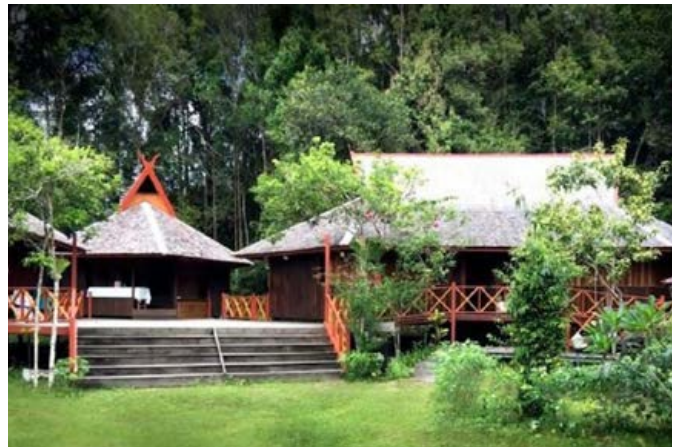
ECO VILLAGE, RUNGAN SARI

Layanan transportasi akan disediakan dari Rungan Sari ke lokasi Swiss-Belhotel (sekitar 45 menit berkendara).