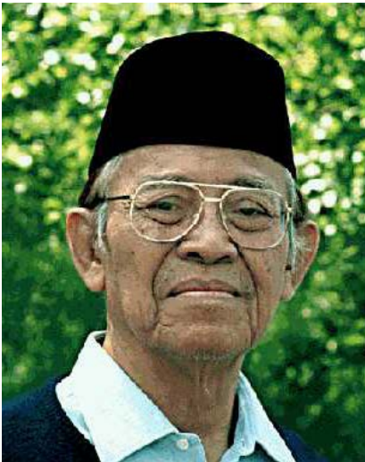
BAPAK DI VANCOUVER, BC - JULI 1981

Saudara-saudara, sebagaimana yang telah Bapak selalu katakan bahwa kongres daripada Persaudaraan Kejiwaan Subud, bukan merupakan kongres sebagai biasanya, kongres dari suatu perkumpulan, tetapi kongres dari perkumpulan persaudaraan manusia yang berbakti kepada Tuhan Yang Maha Esa. Dengan demikian sehingga bagaimanapun yang akan dibicarakan dalam kongres, para saudara atau kita tidak akan meninggalkan ketenteraman, ketenangan rasa diri dan sedikit banyak merasakan tuntunan dan bimbingan dari Tuhan Yang Maha Esa. Oleh karena itu maka kepada sekalian para saudara Bapak harapkan agar selama melakukan kongresnya berperasaan sabar, tenteram, tenang dan dapat menyadari dirinya sendiri dan janganlah sampai terganggu oleh pikiran, gagasan, yang beranekaragamnya. Perlunya agar segala sesuatu yang dibicarakan dalam kongres, akan melalui jalannya yang dikehendaki Tuhan Yang Maha Esa. Dengan demikian sehingga kongres dapat berjalan dengan lancar, bersuasana damai, tenteram, penuh rasa persaudaraan.