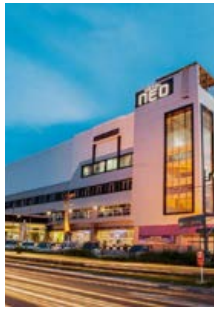
HOTEL NEO PALMA