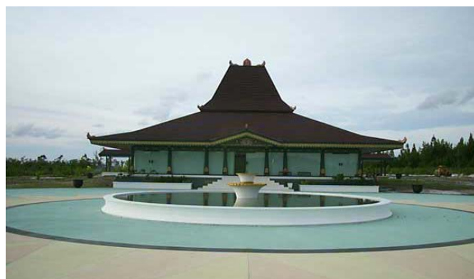
MUHAMMAD SUBUH CENTRE